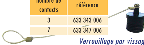
Verrouillage par vissage