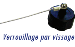
Verrouillage par vissage