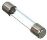
Réf. R090566P (rapide)